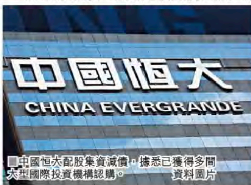
中國恒大配股集資減債，據悉已獲得多間大型國際投資機構認購。

恒大回應查詢時稱，「目前雙方正在積極談判中，進展一切正常，正朝着將策投轉為普通股權方向努力，近期會有結果。」