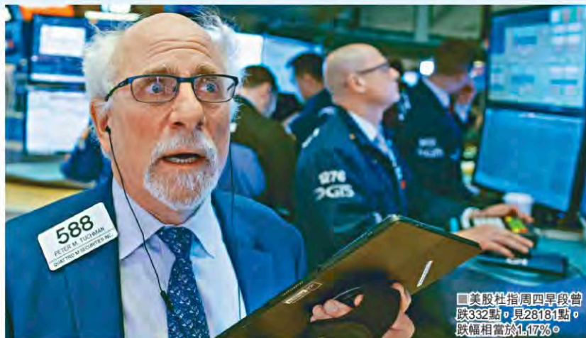
■ 美股杜指周四早段曾跌332點，見28181點，跌幅相當於1.17%。

美國的新一輪刺激經濟方案，在重重政治阻力之下，相信難以在總統選舉之前通過，加上就業數據較預期遜色，美股三大指數周四早段顯著下跌。美股杜指早段跌332點，見28181點，跌幅相當於1.17%。標普指數亦跌1%，見3453點。至於以科技股為主的納斯達克指數，早段亦跌1.1%，見11544點。